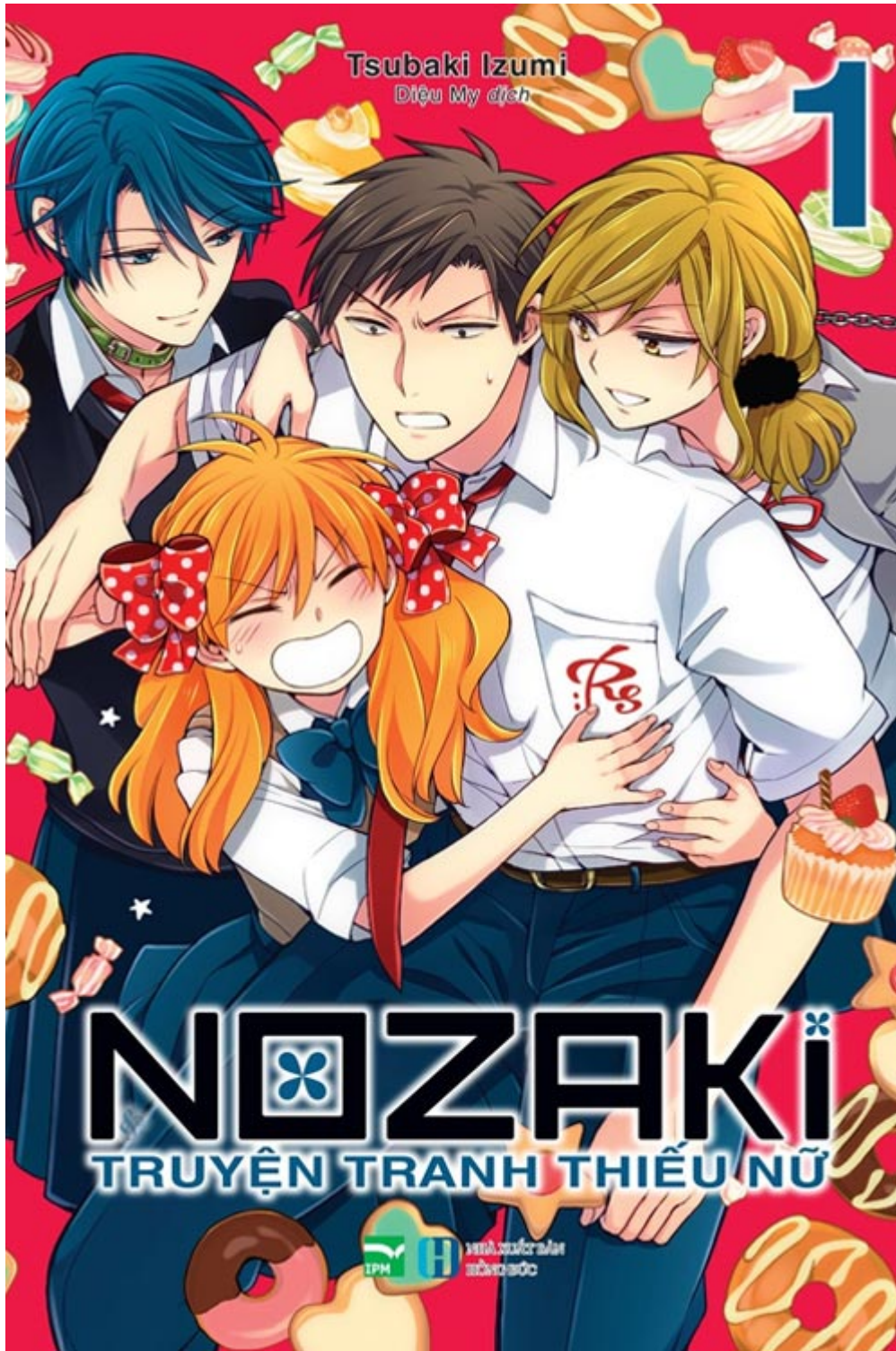
Tập 1 (Đặc biệt)